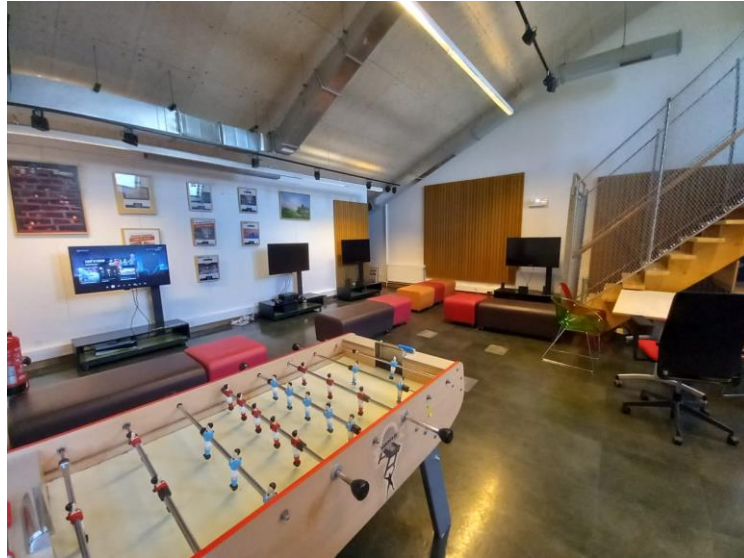
Figure 7 Espace de jeux vidéo

Quant aux emprunts de documents, les usagers ont le droit d'emprunter jusqu'à 20 documents pour une durée de 4 semaines, avec la possibilité de renouveler deux fois à condition qu'ils soient inscrits. La bibliothèque dispose d'un catalogue en ligne, de 6 écrans et de multiples consoles de jeu, de 6 automates permettant aux utilisateurs d'emprunter et de retourner des documents en autonomie. Chaque niveau de la bibliothèque est équipé d'un ordinateur dédié à la consultation du catalogue.