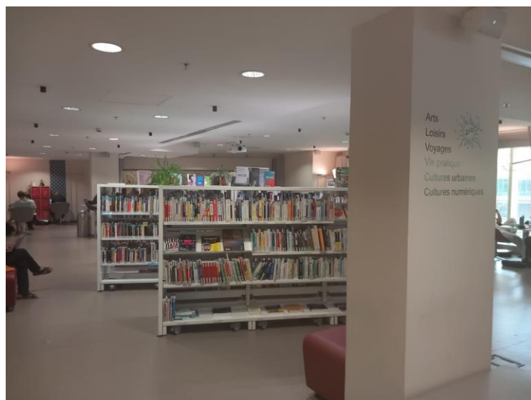
Figure 11 Espace 3 C de la médiathèque de la canopée la fontaine

Inaugurée le 6 avril 2016, la médiathèque de la Canopée la Fontaine s'étend sur une surface de 1 000 m 2 et se compose de trois espaces : l'espace 3C (connecté, créativité et convivialité), côté jardin et l'espace imaginaire.