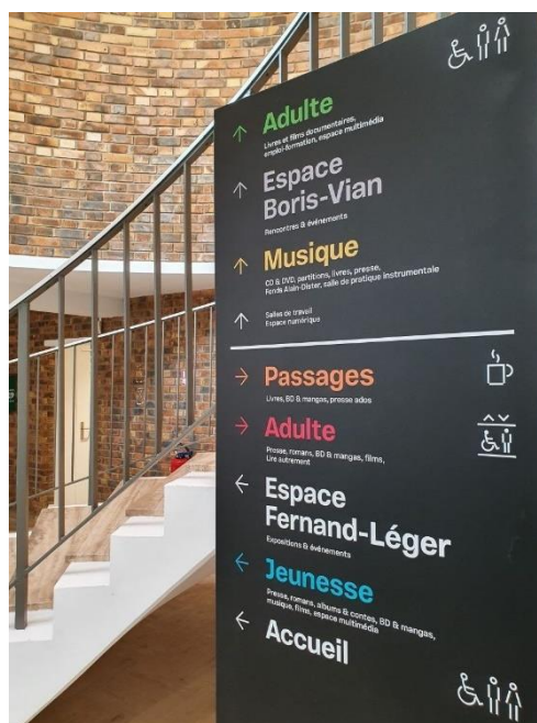
Figure 5 Signalétique à la bibliothèque de Montreuil 1

La bibliothèque Robert-Desnos a été inaugurée en 1974. C'est une des 4 bibliothèques constituant la bibliothèque municipale de Montreuil. Elle occupe un espace d'environ 3 500 m 2 répartis sur trois niveaux, situés entre la mairie de Montreuil et la station de métro. Dès l'entrée se trouve la banque d'accueil qui sert à répondre à toutes les questions des usagers. Elle dispose d'un catalogue en ligne, d'une salle polyvalente, d'une bibliothèque pour la jeunesse, des postes informatiques, des tablettes, d'une salle de lecture et de périodique, d'une bibliothèque pour adulte, d'une salle numérique, d'un espace musical et d'une salle de prêt. Elle se caractérise par la signalétique et par les couleurs variées pour distinguer les espaces.