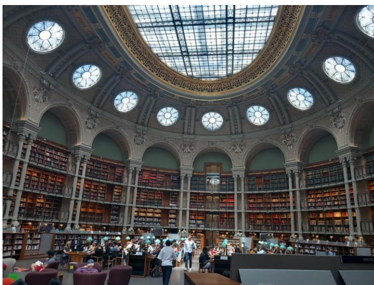
Figure 8 La salle ovale

Après la réouverture du site Richelieu de la Bibliothèque nationale de France, une visite guidée a été organisée le 1 er juin dédiée aux personnels de la Bpi. Le site Richelieu revêt une importance particulière en tant que berceau historique de la BnF. En effet, il comprend une bibliothèque de recherche, un nouveau musée, un nouvel espace d'expositions temporaires, une salle Ovale gratuite et ouverte à tous les usagers, un jardin, d'une librairie ainsi qu'une cafétéria.