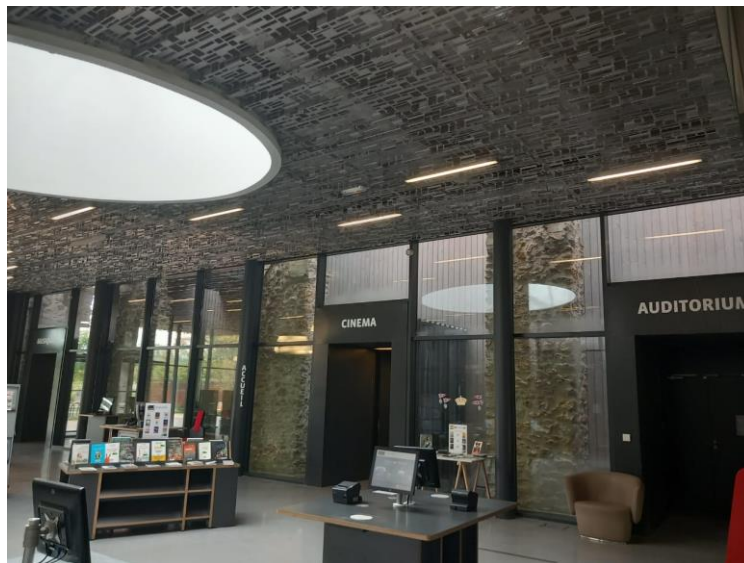
Figure 3 Médiathèque Aimé Césaire

Elle fait partie de l'ensemble des médiathèques de Plaine Commune, regroupant 21 médiathèques et un bibliobus dans les 9 villes du territoire. Installée dans l'ancienne usine Mécano à La Courneuve, elle s'étend sur deux étages organisés en pôles thématiques. Elle comprend un cinéma, un espace musique, un auditorium de 78 places, une terrasse, un espace numérique et des espaces d'exposition. Son fonds documentaire se compose de livres, revues, romans, DVD, CD, bandes dessinées, ouvrages en langues étrangères, mangas, etc. Son public est varié : personnes âgées, enfants, adultes, etc. Elle est ouverte les mardis de 14h à 20h, les mercredis, vendredis, samedis de 10h à 18h et les jeudis de 14h à 18h et fermée tous les lundis.