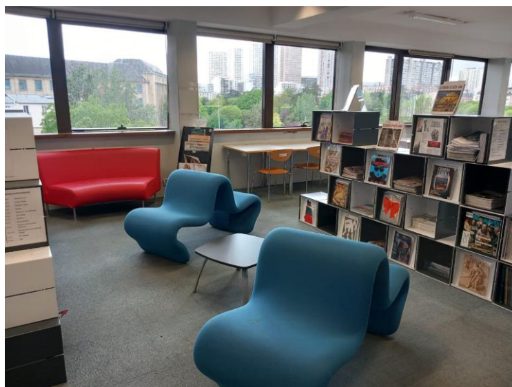
Figure 4 Centre Bibliothèque Pierre Mendès-France

La bibliothèque Pierre-Mendès-France (PMF) est une bibliothèque multidisciplinaire. Sa collection est ciblée vers les domaines enseignés à l'université Paris 1 Panthéon-Sorbonne tels que sciences économiques et gestion, sciences politiques, informatique et sciences de l'information et sciences humaines afin de répondre aux besoins des étudiants. Elle dispose d'un catalogue appelé Mikado. En ce qui concerne les conditions d'accès, l'accès à la bibliothèque est gratuit pour tous les membres de la communauté universitaire : les étudiants, enseignants-chercheurs et personnels de l'université Paris 1 Panthéon-Sorbonne sur présentation de la carte d'étudiant ou professionnelle. La BU est également ouverte le samedi uniquement pour les lecteurs extérieurs inscrits via un formulaire disponible en ligne.