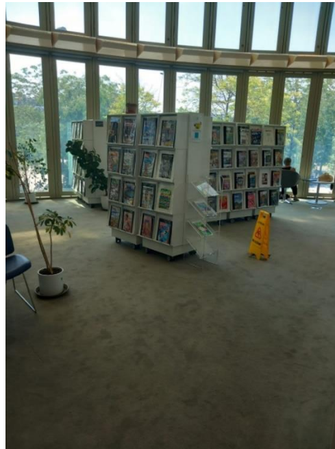
Figure 12 Côté jardin de la médiathèque de la canopée la fontaine

l'autorisation parentale pour les mineurs. Tous les inscrits peuvent emprunter jusqu'à 20 documents pour une durée de 3 semaines avec la possibilité de renouveler deux fois.