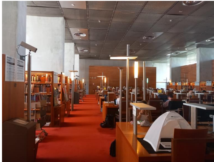
Figure 9 La salle de lecture de la Bibliothèque François Mitterrand

réservé uniquement aux publics munis d'un titre d'accès contrairement aux autres salles de travail qui sont en accès libre.