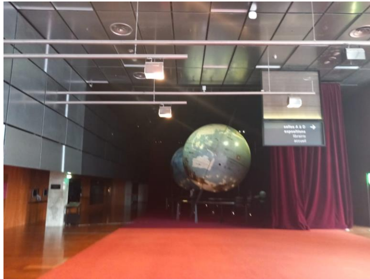
Figure 10 Globes de Louis XIV