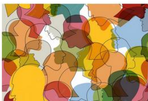
Accessibilité et handicap