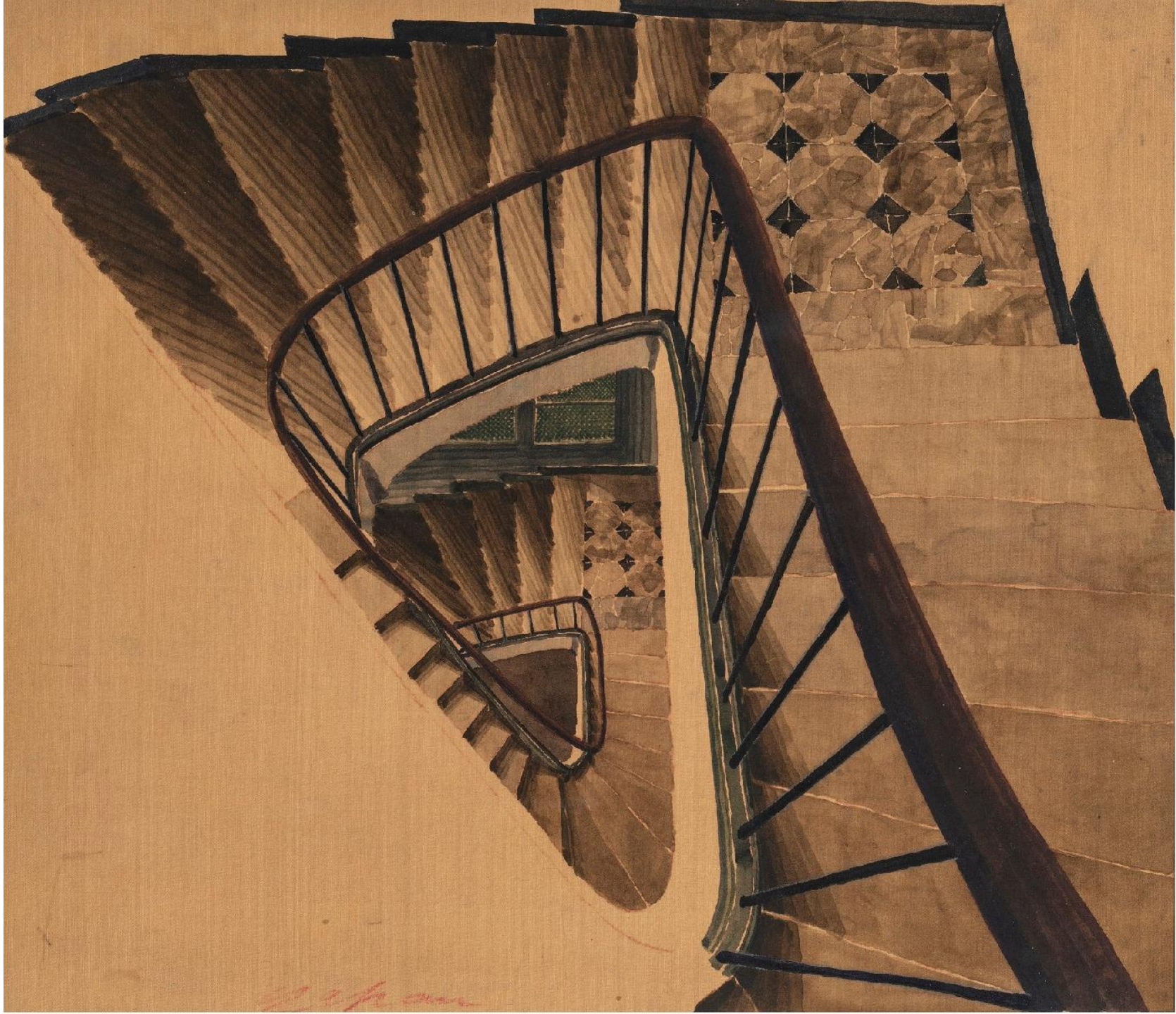
Sam Szafran Escalier 1995