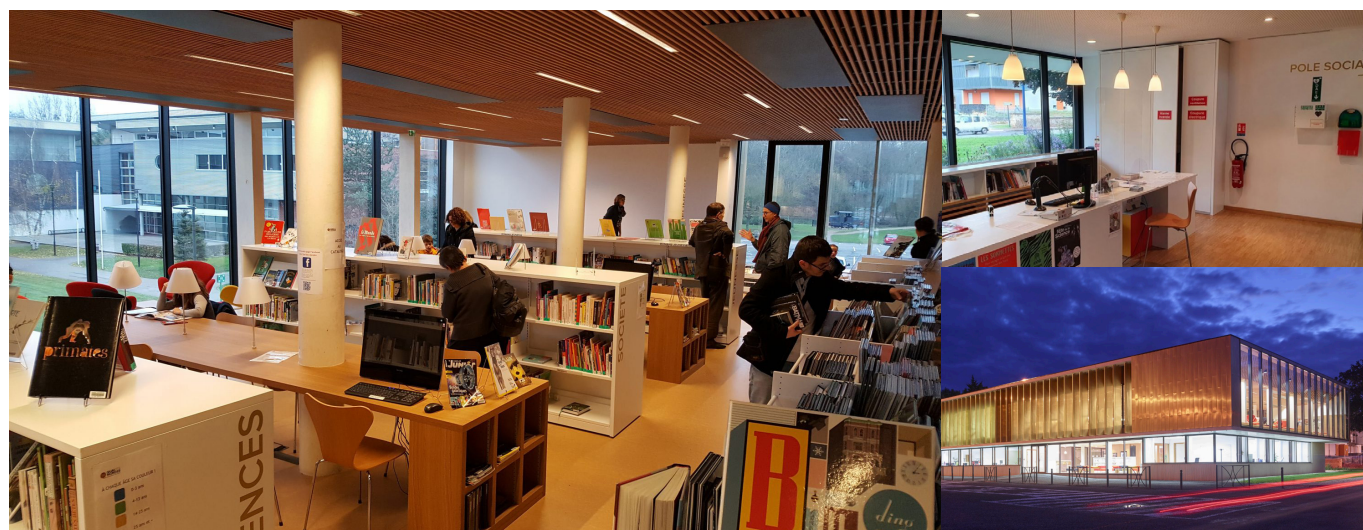
Médiathèque Quai des mondes

Organisée par la Bibliothèque publique d'information, cette journée d'étude vise à présenter les enjeux de tels projets d'équipements mutualisés, selon des orientations diverses et sur des territoires variés. Cela permettra aux participants d'échanger avec des collègues déjà impliqués dans ces projets et ayant déjà été confrontés à des enjeux semblables aux leurs.